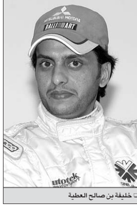
خليفة بن صالح العطية